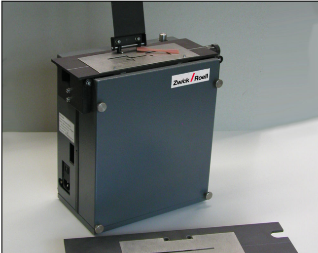
Automatisches Markiergerät, Zusatzschablone zum Markieren von Messlängen 50 ... 100 mm