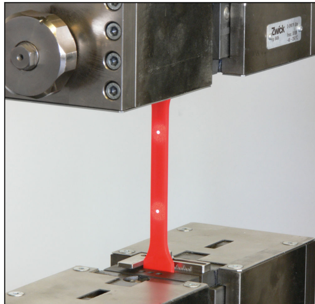
lightXtens, markierte Probe

Der lightXtens ist ein robustes, sehr zuverlässiges System auch in rauhem Umfeld. Er ist unempfindlich bei äußeren Einflüssen wie Lichtveränderungen, Fremdlicht und Luftverwirbelungen. Der lightXtens arbeitet verschleißfrei.