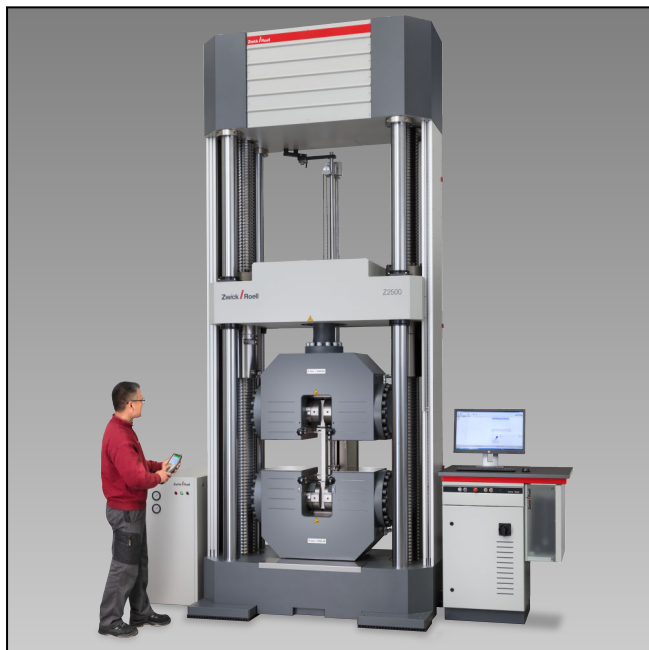
Z2500E mit Hydraulik-Probenhalter